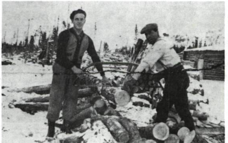
Le sciage du bois.