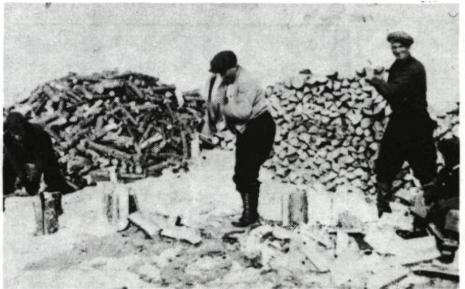
Le fendage du bois.