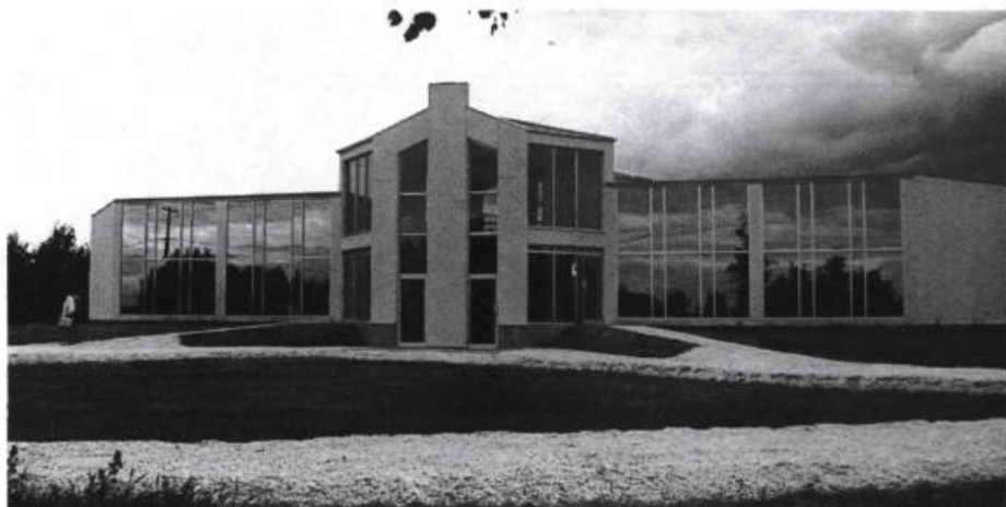
Musée Louis-Hémon à Péribonka.

appartenu à l'écrivain; la salle II étale des oeuvres d'art du Canada et de l'étranger et la salle III présente des «expositions itinérantes» que se partageront le Québec et la Bretagne, lieu de naissance de Louis Hémon. Le nouveau musée ouvre ses portes du mois de juin au mois de septembre.