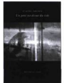
Claude Paradis Un pont au-dessus du vide