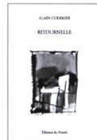
Alain Cuerrier Ritournelle

la collection Initiale : de nouveaux auteurs, de nouvelles voix