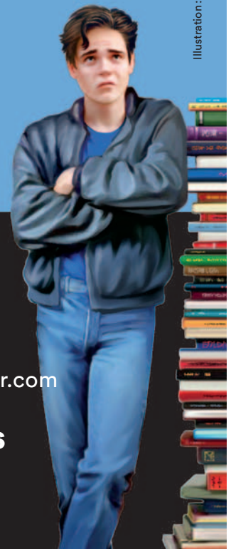
Illustration : Irina Pusztai

Un beau moment de lecture... même pour ceux qui n'aiment pas lire !