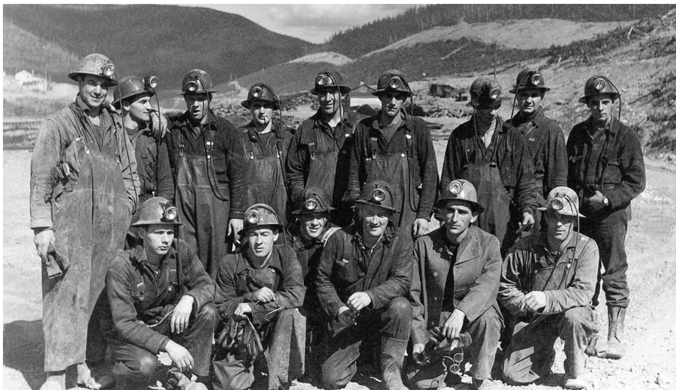
Un grand nombre d'employés à Mines Gaspé viennent de la Haute-Gaspésie. P223/16/6.