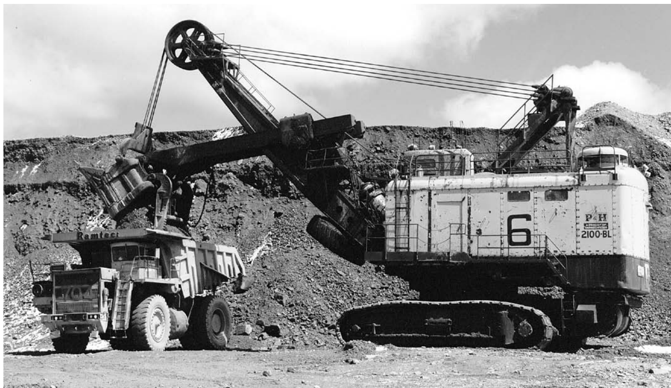
Machineries au travail à Mines Gaspé.

Photo : Musée de la Gaspésie. Fonds Gaspé Copper Mines. P223/6.