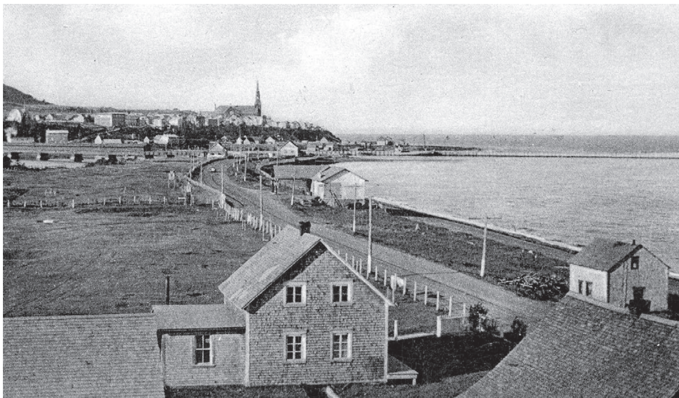
L'église domine le paysage de Cap-Chat.