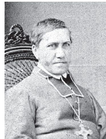
Mgr Edmond Langevin, évêque de Rimouski. De 1867 à 1922, les paroisses gaspésiennes relèvent du diocèse de Rimouski.