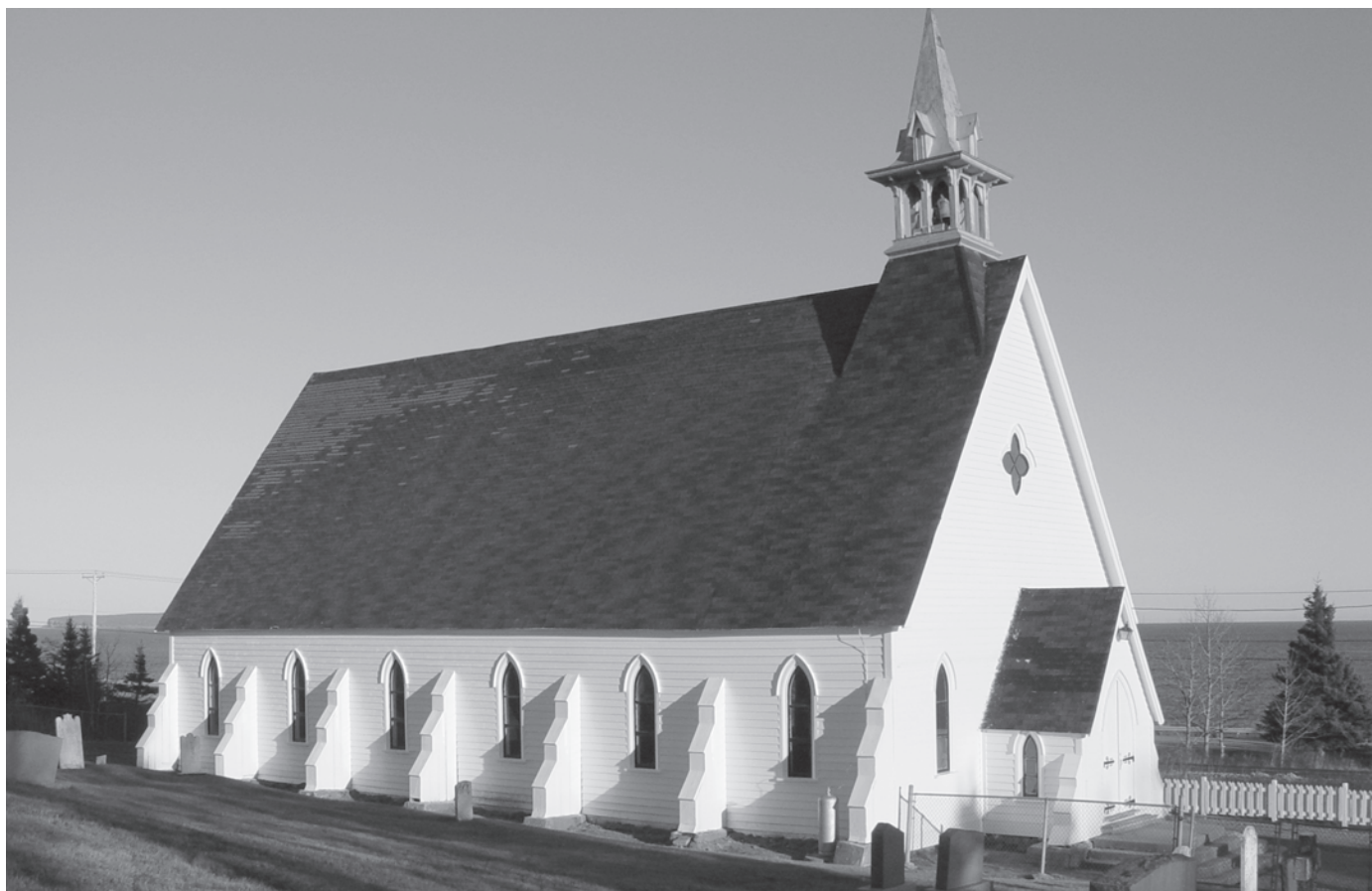
L'église St-James de Cape Cove en 2004.