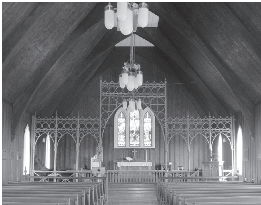
Intérieur de l'église St-James en 2003.

La nouvelle église contiendra 32 bancs de 11 pieds de long avec assez d'espace pour accueillir 200 personnes assises. L'église Saint-James, qui subsiste aujourd'hui, est construite à l'est du cimetière et la construction se termine en 1882.