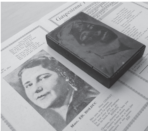
Bloc d'impression en demi-teinte, utilisé pour reproduire des photographies sur des recueils de chansons de La Bolduc.