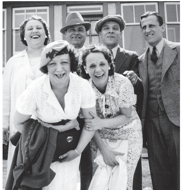
La « Troupe Bolduc » en 1936.

Photo : Musée de la Gaspésie. Fonds Madame Édouard Bolduc. P11/8.