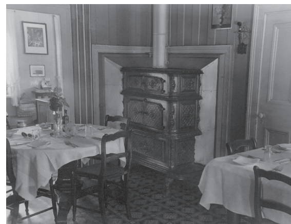
Salle à manger de La Vieille Maison dans les années 1940.