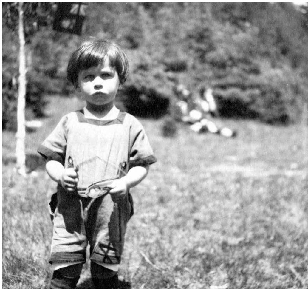
René Lévesque à trois ans.

[...] D'une saison à l'autre (à New Carlisle), nous courions ainsi de la forêt à la mer. Galopant à travers la « Commune » puis enjambant la voie ferrée, nous arrivions au quai,