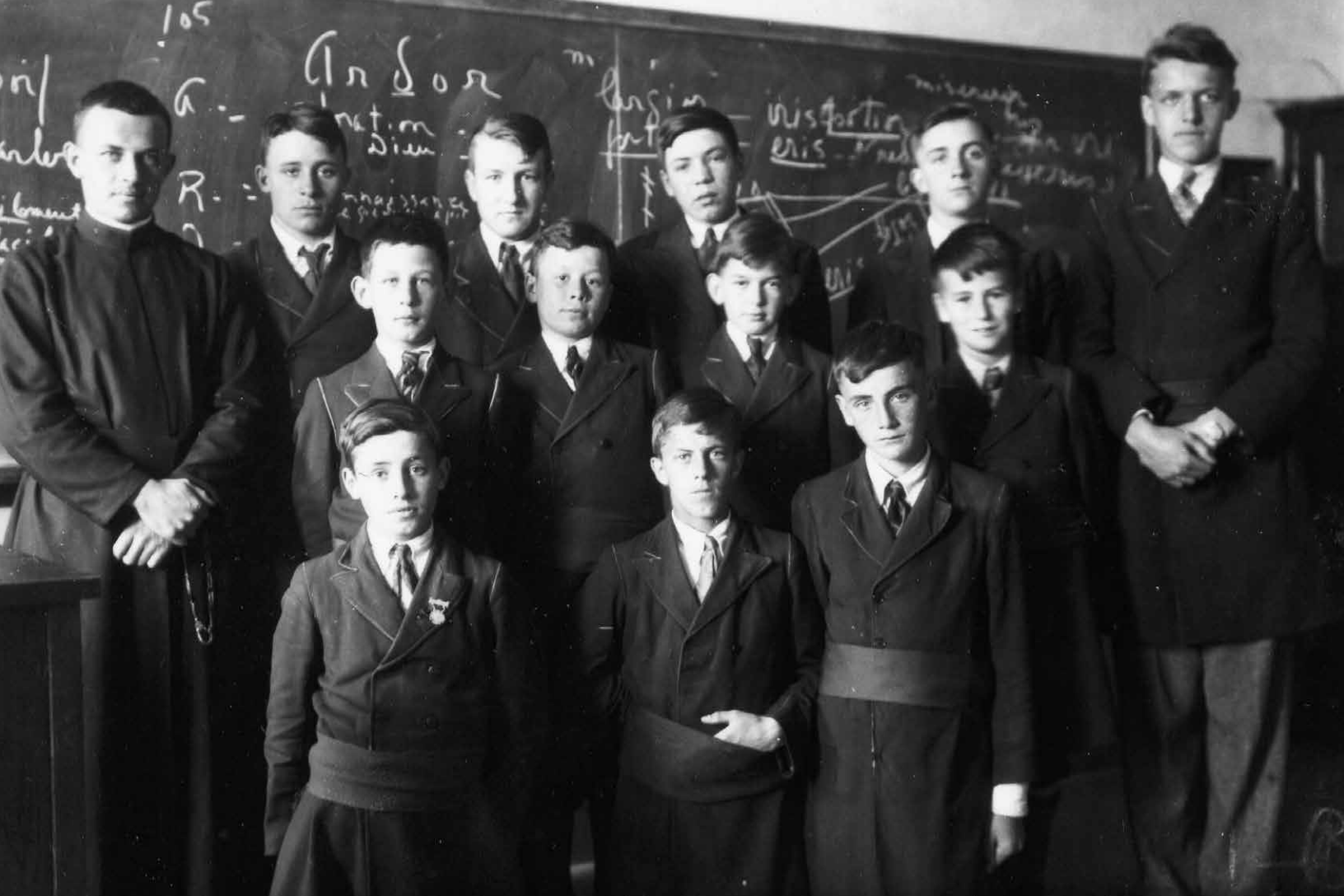
René Lévesque fréquente le Séminaire de Gaspé de 1933 à 1938. Il est le premier de la deuxième rangée sur cette photo de sa classe en Éléments Latins. Élève surdoué, Lévesque remporte sans grands efforts, plusieurs premiers prix à la fin de son année scolaire 1933-1934: Prix spécial en Éléments-Latins, prix spécial d'excellence, premier prix d'orthographe, premier prix de narration française, premier prix de thème latin, premier prix de version latine, premier prix d'histoire du Canada, deuxième prix de préceptes français et latins. Et il maintiendra cette belle moyenne au cours de ses quatre autres années au Séminaire de Gaspé.