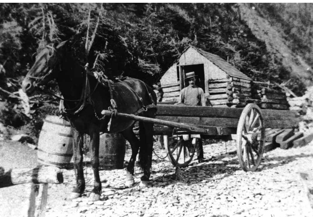
Le cheval avait son utilité à Canne-de-Roches.