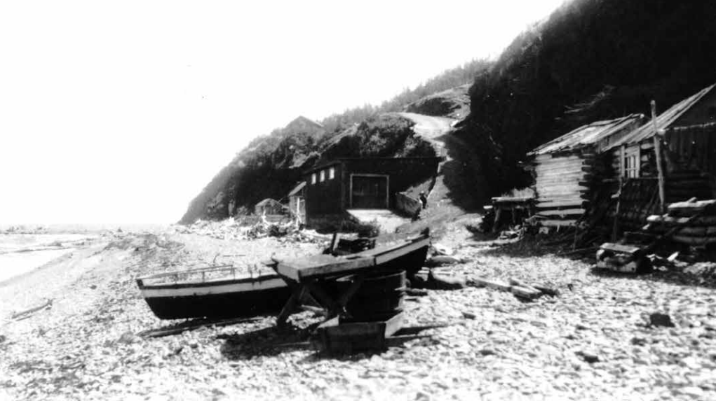
Cabanes de pêcheurs à Canne-de-Roches.