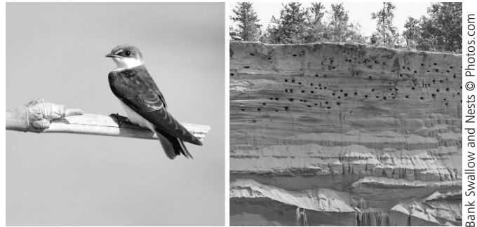
Bank Swallow and Nests © Photos.com

Source : Ministère de l'Environnement, du Développement durable et de la Lutte contre les changements climatiques