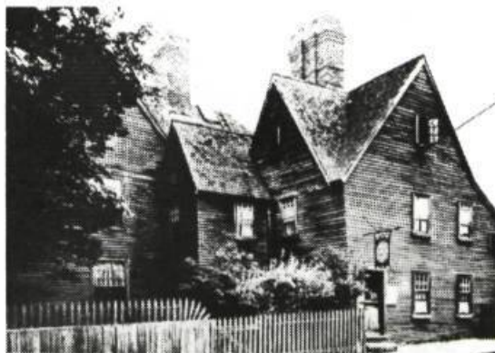
La maison aux 7 pignons

Dimmesdale) et que l'allégorie génère d'autres lectures.