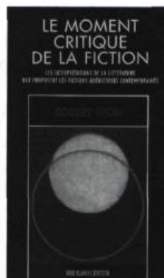
LE MOMENT CRITIQUE DE LA FICTION Robert Dion 208 pages 22 $