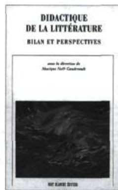
DIDACTIQUE DE LA LITTÉRATURE Bilan et perspectives Sous la direction de Monique Noël-Gaudreault 257 pages 24 $