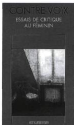
CONTRE-VOIX Essais de critique au féminin Lori Saint-Martin 295 pages 24 $