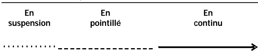
FIGURE 2 Un continuum de la paternité

Une typologie en continuum comportant trois situations types de paternité est ressortie de ce travail de construction théorique sur des cas précis. On y retrouve au départ une paternité dite en suspension , ensuite une paternité en pointillé et finalement une paternité en continu . Trois pères ont été placés dans le premier segment du parcours, sept, dans le suivant et sept autres, dans le dernier.