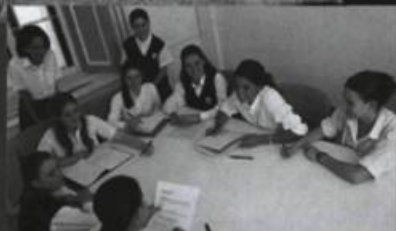
École ciblée de la Commission scolaire Marguerite-Bourgeoys