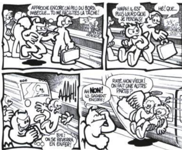
« Un démon dans le métro », secondaire 1 et 2, école Saint-Alphonsus.

Lorsque cinquante personnes cherchent une solution, celle-ci se fait rarement attendre. Une fillette a dit « Euh... elle le mange ? »