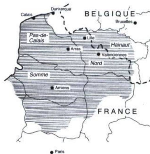
Zone hachurée : aire linguistique du picard. Ligne en tirets : frontière franco-belge.

Au point de vue linguistique, ce territoire était le domaine du dialecte picard qui, avec d'autres tels que le normand, le tourangeau, le champenois par exemple et, bien sûr, le francien (devenu le français) sont des langues d'oïl, issues du latin populaire, qui fut fortement marqué par les parlers germa-