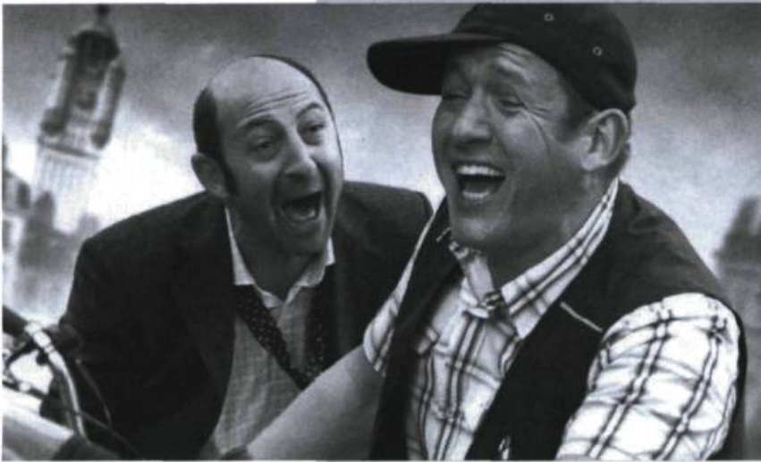
Bienvenue chez les Ch'tis, 2008.