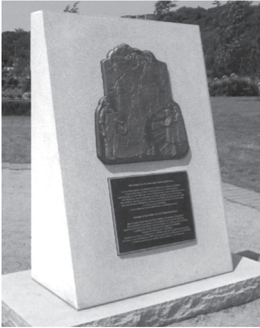
Monument offert par les Franco-Américains à la Ville de Québec en 2008, l'année du 400 e anniversaire de sa fondation