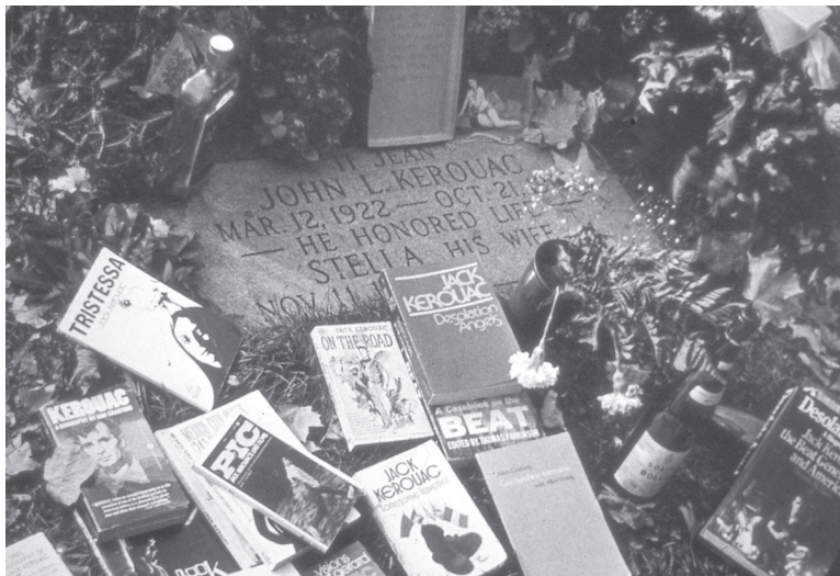
Tombeau de Jack Kerouac, cimetière Edson à Lowell, le 21 octobre 1979 dixième anniversaire du décès de Kerouac