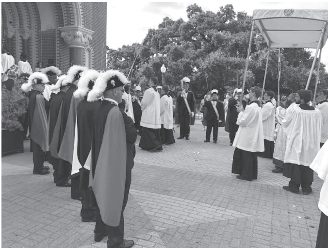
Arrivée de la procession à la cathédrale Saint-Jean à Lafayette