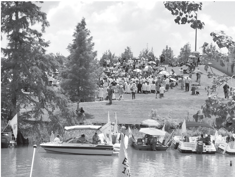
Arrivés à Lafayette, les participants sont en prière