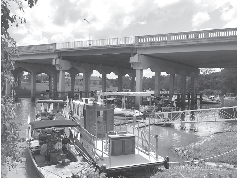
Les participants débarquent à Lafayette pour réciter un chapelet