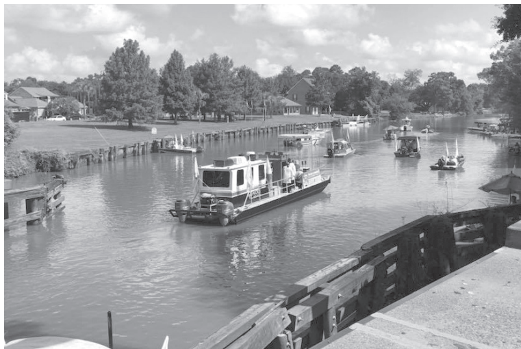
Départ de la procession à Abbeville

Le 15 août marque à la fois la fête nationale des Acadiens et la fête de l'Assomption de la Vierge Marie, la sainte patronne des Acadiens. En Louisiane ces deux fêtes coïncident en une seule célébration. Chaque année depuis 2015, une procession d'une centaine de bateaux représentant les paroisses du diocèse de Lafayette remonte le bayou Vermilion. Le défilé est avant tout un évènement religieux comprenant deux messes (dont une en français), des chapelets et des bénédictions. La Fête-Dieu du Vermilion témoigne du rôle important de la foi catholique comme composante de l'identité cadienne ( cajun ) en Louisiane aujourd'hui.