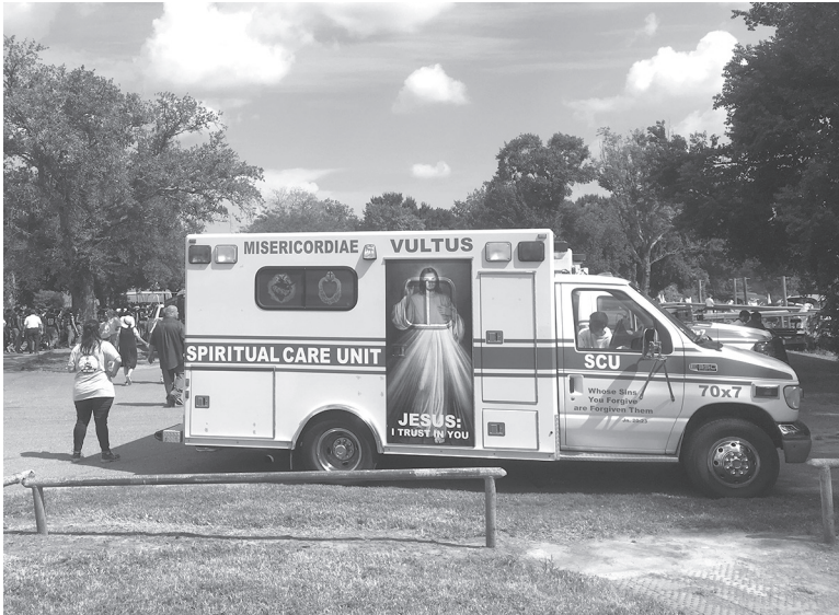
Ambulance transformée en confessionnal mobile

Pendant toute la procession une ancienne ambulance transformée en confessionnal mobile suit le groupe sur les routes du long de la rivière. Les fidèles peuvent donc se confesser lors des différents arrêts au cours de la journée.