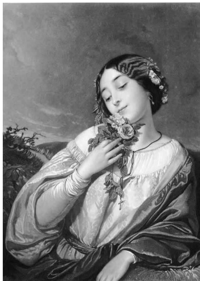
Figure 5. H. Garnier, d'après un tableau de Schlesinger, L'odorat , 1850, gravure, 49 x 35 cm, Londres, British Museum.

En contrepartie, plusieurs critiques évoquent l'odeur émanant du tableau pour indiquer qu'ils ont flairé l'allégeance à l'académisme et aux conventions bourgeoises 73 . Zola écrit ainsi : « Je ne peux malheureusement pas rendre justice à l'aspect élégant de cette dame – une sultane de harem typique – ni faire sentir tout le parfum de poncif et de bêtise bourgeoise exhalé par ce tableau » 74 , tandis que Castagnary commente en ces termes, relevant du dégoût, un tableau de Bouguereau : « Son groupe a une vague odeur de patchouli et de pommade. C'est doux et écœurant » 75 . Opposer les valeurs de l'artiste à celle des bourgeois 76 n'est cependant pas le seul ressort de ces critiques d'art quant à l'olfaction. Les tenants du réalisme ont également mêlé les arguments esthétiques à la critique olfactive en soulignant l'usage du noir par la peinture académique et la peinture romantique, les deux écoles dont ils distinguent le réalisme. Zola, par exemple, file cette métaphore dans son roman sur l'art :