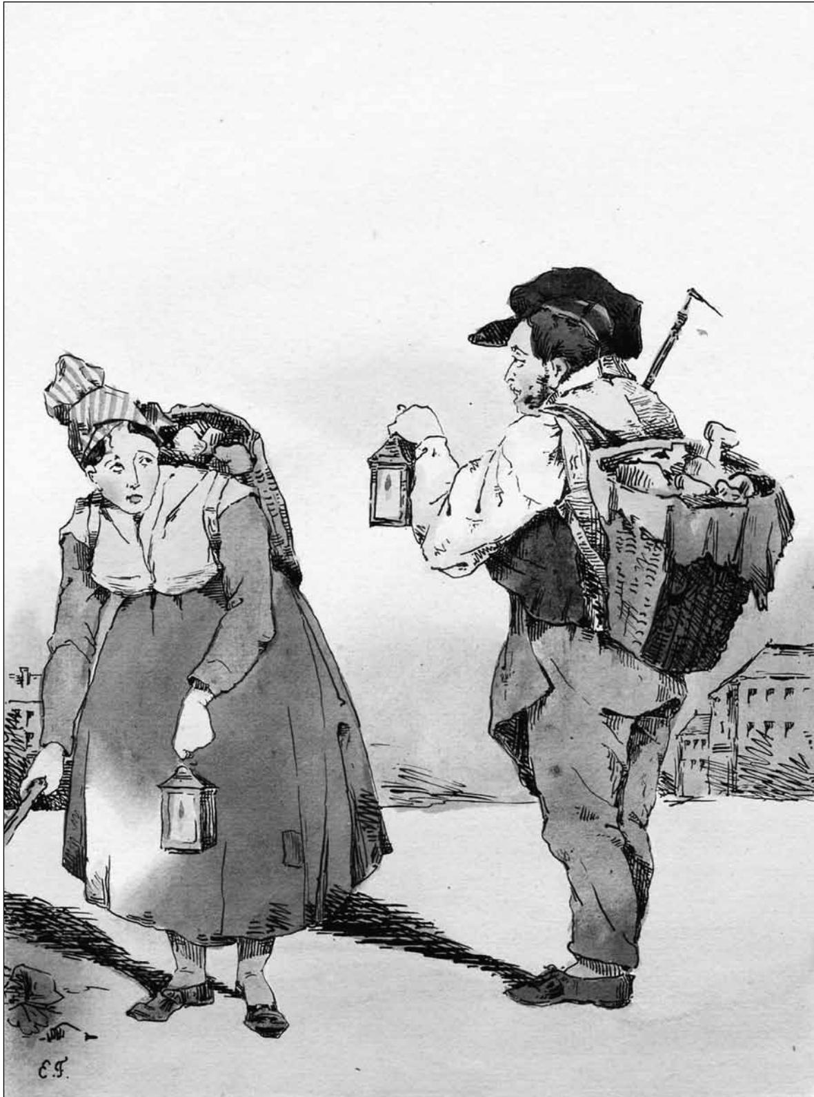
Figure 4. Eugène Forest, Souvenirs d'un flâneur de Paris : Rue Mouffetard, vers 1830 , lithographie colorée à la main, 15 x 11 cm, Londres, British Museum.