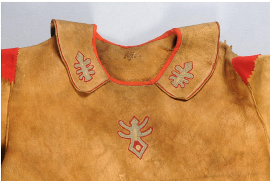
Photo 4 Motif de tshiheu (National Museum of the American Indian, Smithsonian Institution, Manteau n° 146930.000.)