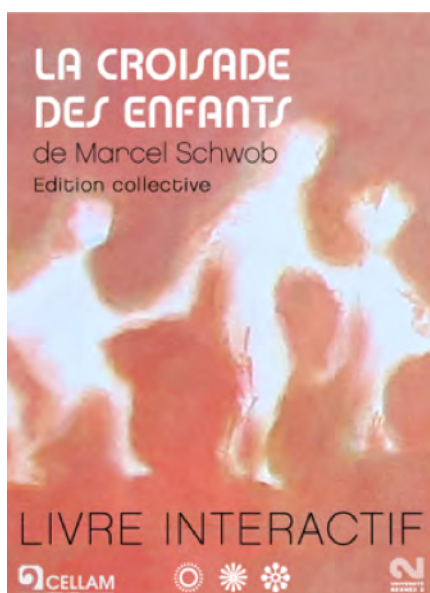
Illustration 1 : Couverture de l'édition enrichie de La Croisade des enfants