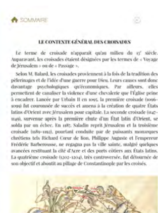
Illustration 4 : Parcours « Explorer, premiers repères » (extrait de l'édition enrichie)

Ce parcours ouvre déjà des pistes vers le troisième volet de l'édition, par exemple à travers un abécédaire interactif.