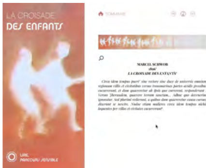
Illustration 9 : Captation vidéo montrant la continuité iconographique des chapitres (extrait de l'édition enrichie)

D'autre part, l'édition numérique peut encourager la perception et l'analyse de l'énonciation littéraire. On peut souligner l'intérêt de la lecture sonore sur ce plan : les voix incarnent les personnages, mais sans chercher à trop singulariser chacun d'entre eux, sans trop appuyer le trait. Ce choix correspond à l'écriture de Schwob, dans laquelle il y a à la fois une singularisation du discours de chaque protagoniste (le lépreux, le goliard, les enfants, les papes, le kalandar) et en même temps une certaine continuité, une homogénéité de l'ensemble des récits organisés de façon linéaire, structurée vers la fin du récit.