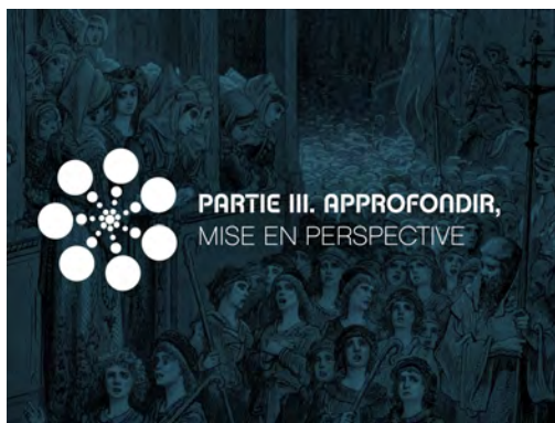
Illustration 8 : Logos des différents parcours (extraits de l'édition enrichie)

Les gestes nécessaires pour parcourir le livre ont été pensés dans cette même perspective : nous avons essayé de faire en sorte qu'ils soient assez intuitifs et cohérents, par exemple, grâce au défilement de l'écran ( scrolling ) présent dans toutes les pages, y compris dans les notes, et au geste de tourner des pages pour changer de chapitre. La notion de page, préservée avec le choix de l'ePub3 fixe, participe de la transition entre le papier et le numérique. Notre édition enrichie reprend des repères issus de l'imprimé (les pages qui se tournent, la linéarité), mais rappelle aussi la lecture Web (avec le scrolling , le bouton sommaire, l'interactivité, ou l'accès au texte via un nuage de tags). Cette transition d'une technologie à l'autre semble nécessaire à l'adaptation du lecteur. Elle était déjà nettement visible dans le passage du manuscrit à l'imprimé. Au début de l'imprimerie, les incunables gardaient des aspects formels du manuscrit en copiant les lettres gothiques et en conservant des éléments manuscrits pour faciliter le repérage dans le livre et éclairer le texte. De la même façon, le livre numérique enrichi, s'il s'émancipe du modèle homothétique, reste encore attaché à la structuration du livre papier, difficile à dépasser sans crainte de sortir de la notion de livre 12 .