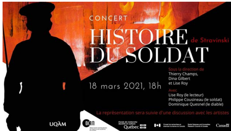
Figure 1 : Affiche officielle de l'événement-concert.