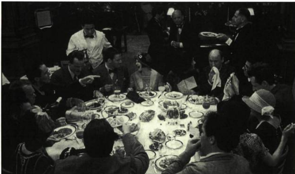
Mrs Parker and the Vicious Circle d'Alan Rudolph

Il est toujours au service de la collectivité. Ainsi le héros de Vivre va passer de l'obsession du jeu à la vie commune où il connaîtra les joies et les difficultés d'une famille. En fait, Yimou n'a pas réalisé ce film pour séduire les étrangers, il l'a fait avant tout pour ses compatriotes afin qu'ils puissent se reconnaître. Hélas! à ce jour, le film est interdit dans son pays. De plus, on ne lui a pas permis de venir présenter son film à Cannes. On a délégué ses deux protagonistes. Si cela peut le consoler — sans compromettre sa carrière — son héros a reçu le prix du meilleur interprète et le jury oecuménique a décerné son prix à Vivre!