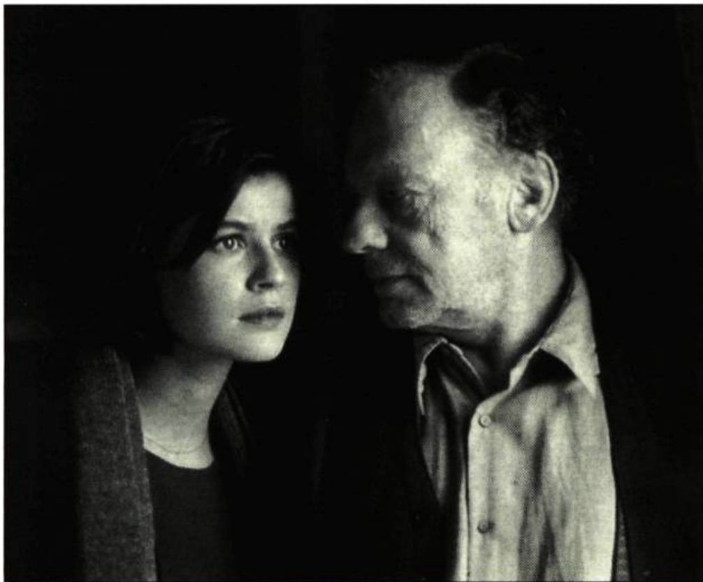
Rouge de Krzysztof Kieslowski

Le titre est habilement choisi. Comment concilier des siècles de culture et de vie sociale enracinées dans le confucianisme avec la croissance économique vertigineuse qu'a connue Taïwan? Si les gens de Taïwan continuent à manger avec des baguettes, ils ne refusent pas de prendre le taxi. En fait, ils n'ont pas oublié l'affirmation de Confucius: «Un Chinois heureux est un Chinois riche». Bien que Taïwan ait connu un boom remarquable après la Seconde Guerre mondiale, il n'est pas dit que tous les habitants se promènent en décapotable. Nous sommes en présence d'une famille où les membres travaillent dans la publicité, le théâtre et l'édition. Et sur le ton de la comédie, le cinéaste évoque la névrose des jeunes personnes que l'on retrouve souvent autour d'une table dressée. Les nombreux personnages ne permettent pas une lecture facile, alors que les disputes surgissent. Edward Yang place ses personnages devant la caméra et ils parlent, ils parlent, ils parlent. Pendant plus de deux heures, nous assistons à des «débats» où les sentiments se heurtent. Serez-vous surpris si je vous dis que la salle s'est vidée de moitié? C'est tout dire. ☆