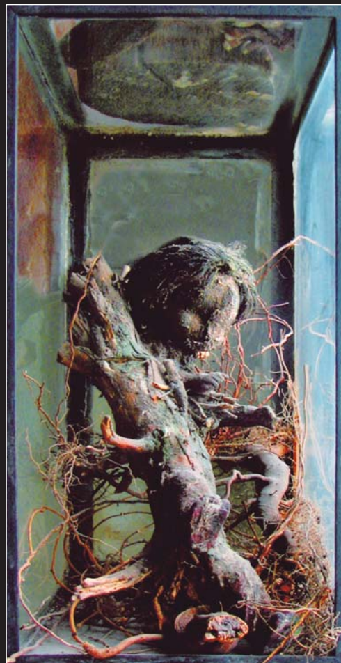
Christine Palmiéri, Restes mutants , 1995 Installation-sculpture, 60 cm x 40 cm x 40 cm, bois, terre, silicone, poupée de caoutchouc, aquarium

Pour se débarrasser de la sublime illusion que l'avenir est inépuisable, nous voulons envisager que le temps s'arrête. Car le temps sépare la pensée et le mouvement. Quand la pensée redevient mouvement, quand le désir est