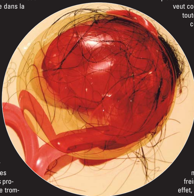
Christine Palmiéri, Poils , 2008 Impression jet d'encre, 60 cm x 60 cm

Nous sommes prêts à concéder que le sublime est fondé sur une illusion, pourvu que le sublime ne perde rien de sa hauteur ! Or l'illusion n'est pas toujours sublime, elle est parfois soporifique et toxique, affolante et mortelle. Le postmoderne n'a pas su freiner la prolifération des illusions. En effet, lorsque l'illusion est totale, nous sommes privés de repères pour départager le réel de ses fantômes. L'illusion