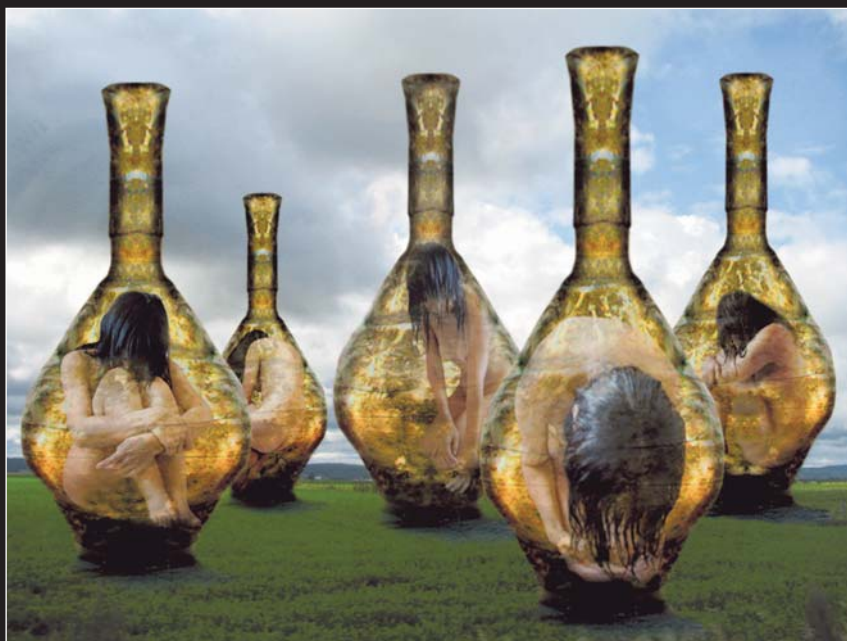
Christine Palmiéri, Les séquestrées , 2009 Impression jet d'encre, 150 cm x 185 cm

Certains affirment que par le seul fait de côtoyer le sublime, fût-il l'effet d'un artifice ou d'une violence, nous serons élevés et ennoblis. Je voudrais croire qu'à vivre dans l'intimité du monde, je serai moi-même ennobli et grandi. C'est une sublime illusion à laquelle je consens davantage. ©