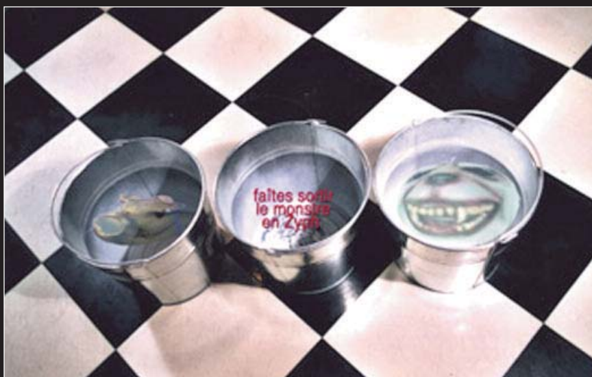
Christine Palmiéri, Le monstre , 2004 Installation vidéo interactive, présentée à la Galerie Verticale

Lorsque le monde devient chaotique, nous ne parvenons plus à en extraire des messages. Lorsque le désordre est trop grand, tout verse dans l'irreprésentable. Les ignominies du siècle dernier et les désordres de notre nouveau millénaire révèlent une part plus grande de l'innommable. L'innommable s'accroît sans cesse. Proportionnellement la science semble accroître sa capacité de rationaliser notre