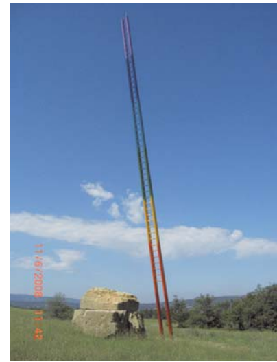
L'Échelle de Jacob, 2007 Carbone, laque H. 20 m. Collection privée Cortoisie des artistes

Mnémosyne m'est mille lieux : je suis dans le Théâtre de la mémoire inventé par Camillo à la Renaissance, je suis dans le poème de Hölderlin ou dans un conte fantastique à la Borges, je suis dans la tête même de Warburg qui créa l'Atlas Mnémosyne , c'est ici la nouvelle Atlantide, c'est ici la Matrice ... À l'instar de l'archéologue, je spéculer sur ce qui se découvre à moi, je m'improvise archéologue et grand architecte, je fouille et je devine, j'invente des liens, je lance des ponts par-dessus l'hétérogénéité des matériaux qui constituent la fiction de Mnémosyne . Fiction trouée, disjonctée,