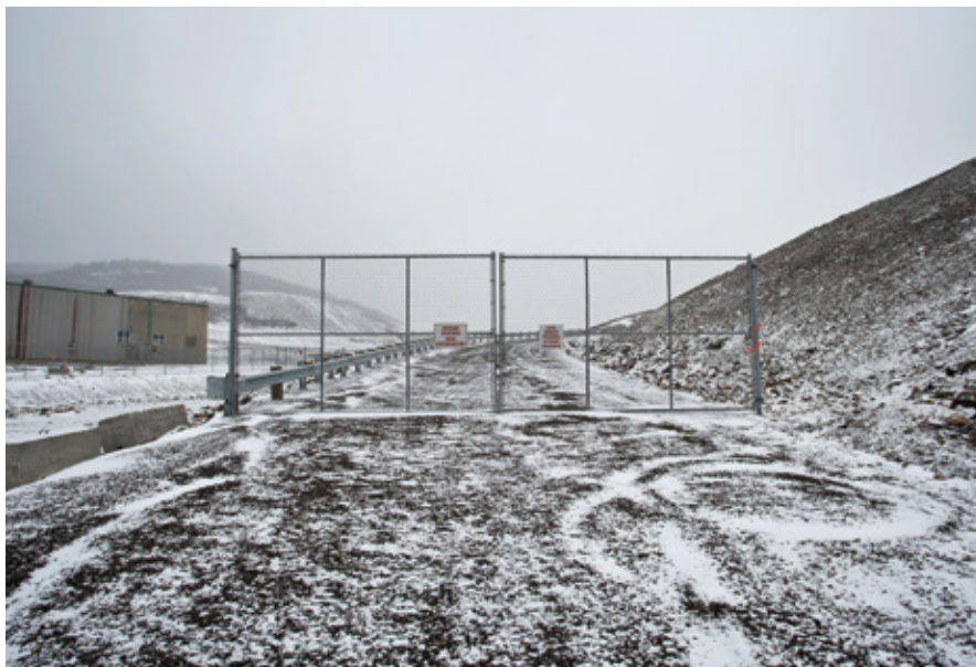
Myriam Gaumond, De la série Le vent est tombé , 2017

Ici, une borne incognito, là, un simple panneau, une barricade bancale ou un barbelé usé : Sur la ligne frontière était présentée dans le Parc de la Pointe Taylor à New Richmond, superbe parcours à l'orée de la forêt, où une procession de boîtiers attendait le visiteur. Ici, l'intégration des œuvres est plus réussie, nichée au cœur d'une clairière tapissée d'aiguilles d'épinettes. Les postes frontaliers à ciel ouvert captés par l'artiste faisaient littéralement écho au lieu d'exposition,