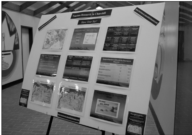
ILLUSTRATION 2 : Affichage à Churchill.