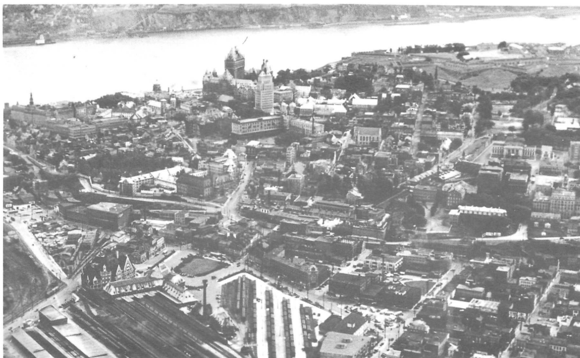
Photo aérienne de l'Arsenal de la Côte du Palais S.A. Photos de la ville de Québec, Québec, Commissariat à l'industrie, 1946, AVQ Sous-Série du Commissariat à l'industrie NB: 474/035