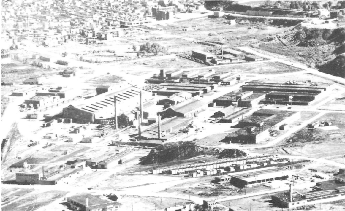
Photo aérienne de l'Arsenal de Saint-Malo en 1946