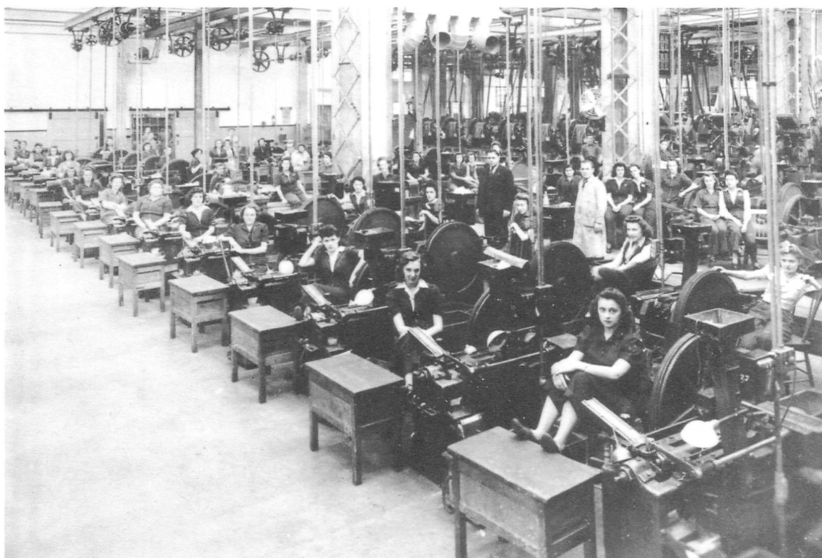
Vue intérieure de l'usine de munitions St-Malo (impression photographique), [ca 1940–1945].

poste sur 5) et de Valcartier (2 postes sur 5) subissent des coupures beaucoup moins importantes. À la lumière de cette disparité dans les compressions, il apparaît évident que l'administration de l'entreprise se conformait à la recommandation prise par le "Joint Arsenal Planning Board" de convertir l'Arsenal de Saint-Malo en "a permanent post-war factory for Small Arms Ammunition" 24 et en décidant de procéder à un plus grand nombre de coupure de postes, proportionnellement, à l'Arsenal du Vieux-Québec qu'à celui de Saint-Malo.