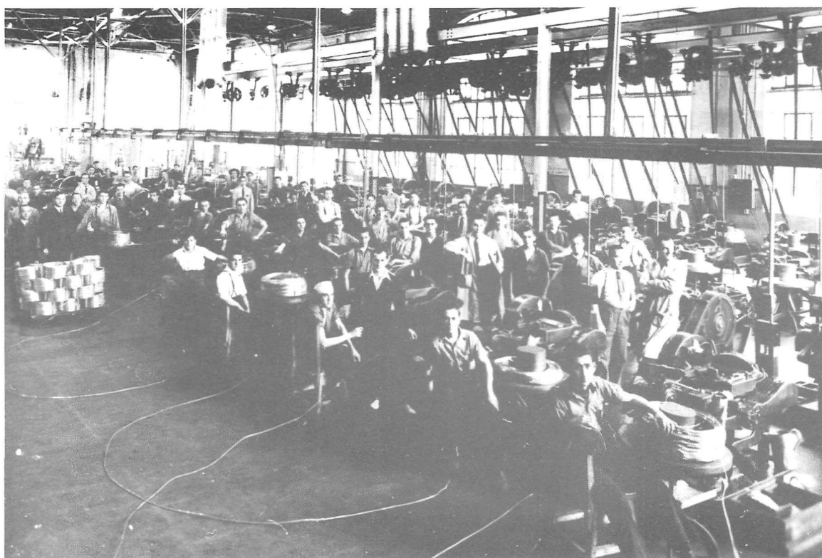
Vue intérieure de l'usine de munitions St-Malo (impression photographique), [ca 1940–1945].

subséquente des départements de la production et d'inspection des cartouches.