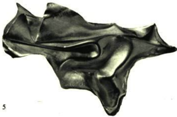
5 — LACTUCA. 1963