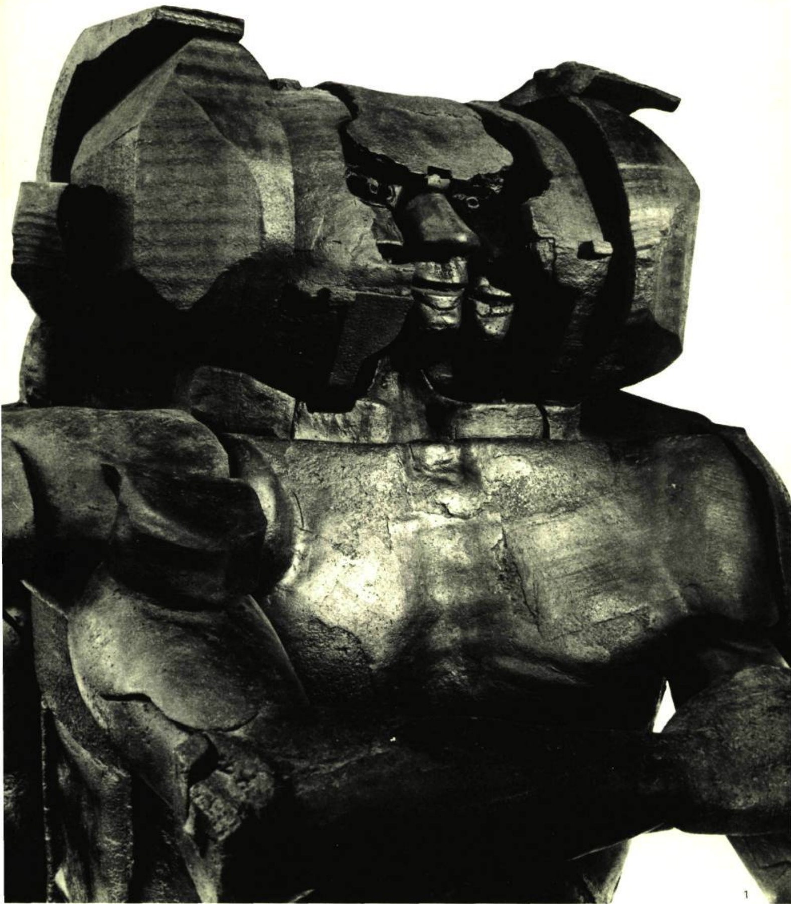
1. ECBATANE, 1965. Bronze. Haut.: 68 po. (170cm); larg.: 40/80 po. (100/200cm). (Phot. Jacqueline Hyde). 2. ROGER ET LE PEUPLE DES MORTS, 1959/62. Ciment. 47 po. \frac{1}{4} sur 47 \frac{1}{2} sur 55 \frac{1}{6} (120 x 120 x 140cm). (Phot. Galerie Claude Bernard). 3. LA FEMME AU BAIN, 1966. Bronze. Haut.: 59 po. (150cm); larg.: 43 po. (110cm); long.: 79 po. (200cm). (Phot. Galerie Claude Bernard).