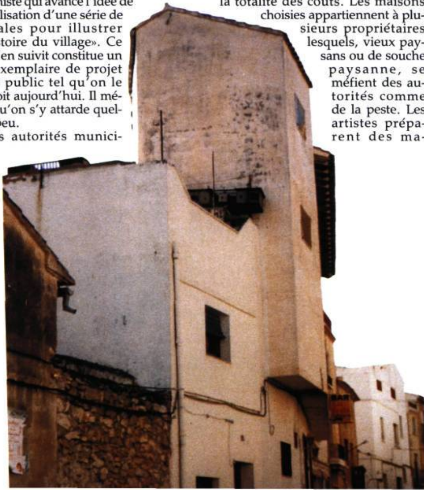
Maisons à Calpe avant l'intervention de l'artiste.

La municipalité est gagnée au projet et lui attribue un budget. Elle défrayera la totalité des coûts. Les maisons choisies appartiennent à plusieurs propriétaires lesquels, vieux paysans ou de souche paysanne, se méfient des autorités comme de la peste. Les artistes préparent des ma-