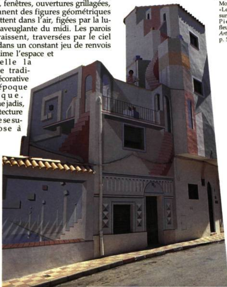
L'Escalier rose , 1989. Murale à Calpe.

1. Voir Luis de Moura Sobral, «Les dessins surréalistes de Pierre Lafleur», Vie des Arts , 1975, 80, p. 52-55.