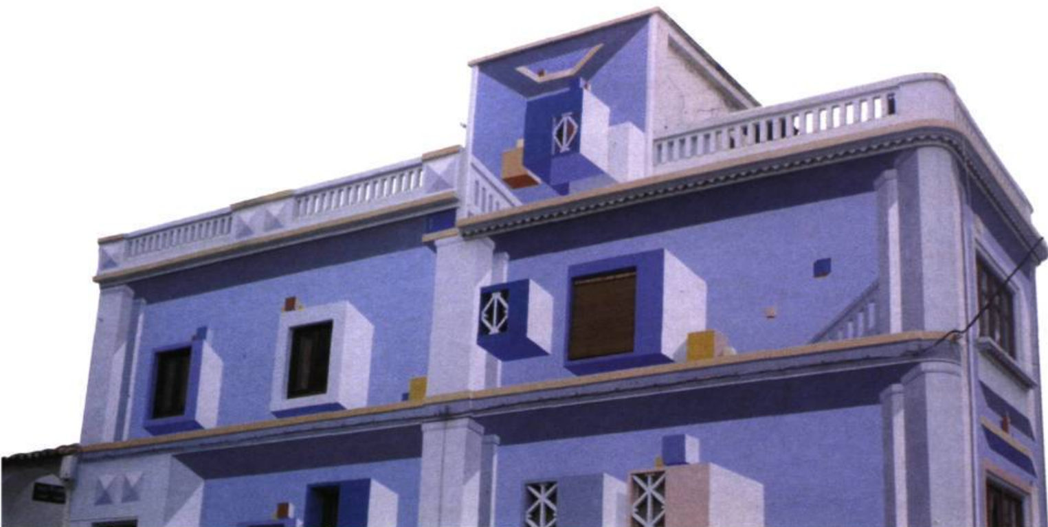
Les nacelles, (détail), 1989. Murale à Calpe, Alicante, Espagne.