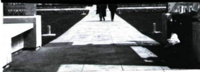
Centre canadien d'architecture

Analyse de l'évolution de la représentation du sida dans des œuvres de diverses techniques produites entre 1985 et 1990, aux États-Unis.