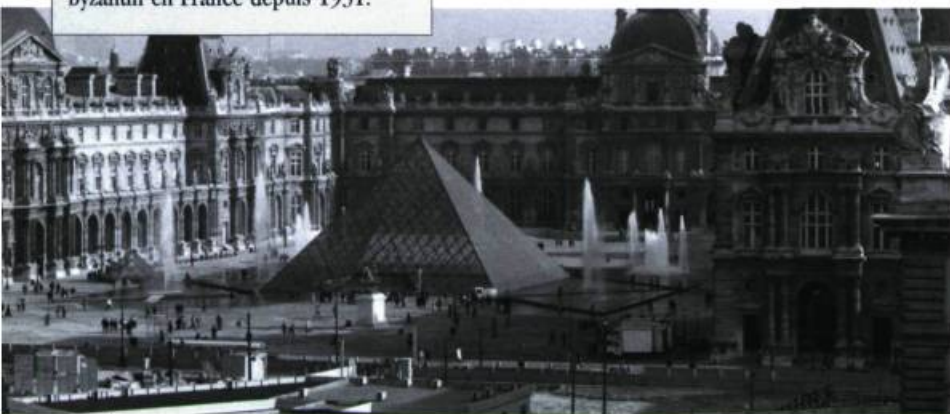
Musée du Louvre

32 peintures et deux sculptures tirées de la collection de la galerie portant sur le thème du nu.