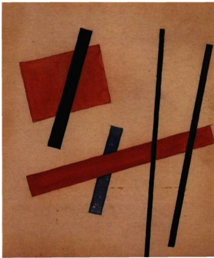
Aquarelle et encre de Chine, 13,5 x 11,0 cm.

Feuille volante No1 de l'Ounovis son premier article théorique intitulé «le nouveau réalisme. Notre époque contemporaine.» En 1921, l'Exposition des travaux de l'Ounovis est présentée à Moscou. En 1922, Khidekel dessine ses premiers projets de ville aérienne. Il obtient son diplôme «d'artiste libre». En 1924, il s'inscrit à la Faculté d'architecture de l'Institut de génie civil de Leningrad. Il obtiendra son diplôme en 1930. Il fera dès lors une carrière qui le conduira à la réalisation d'importants équipements collectifs. Entre 1950 et 1960, dans le secret de son atelier, il revient à la peinture renouant avec la veine cosmique et musicaliste issue de l'expérience suprématisiste. Il meurt à Leningrad en 1986.