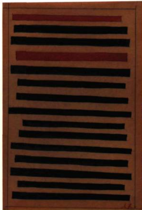
Encre de Chine noire et rouge, 19,5 x 13,8 cm.

Exposition organisée et mise en circulation par le Musée d'art de Joliette 1