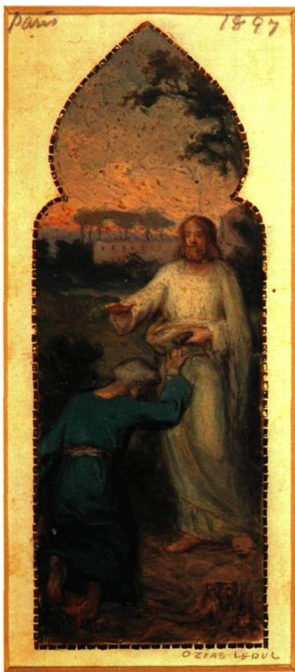
Étude pour Le Christ remettant les clés à Saint-Pierre , 1897 Huile sur esquisse à la mine de plomb sur papier toile 20,2 x 9,1 cm Musée des beaux-arts de Sherbrooke

■ Lorsque nous tombe sous les yeux une photographie comme celle que reproduit J. Craig Sterling dans sa monographie (1) sur le décor de l'église de Saint-Hilaire (1897-1900), montrant Ozias Leduc « tiré à quatre épingles » en compagnie de ses nombreux assistants en vêtements de travail, on comprend le sens de l'ex- pression des gens de l'époque désignant l'artiste comme « un grand peintre d'églises ».