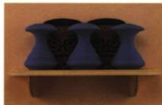
Gregory Payce (Alberta) Vase Pair # 2 22 x 51 x 18 cm