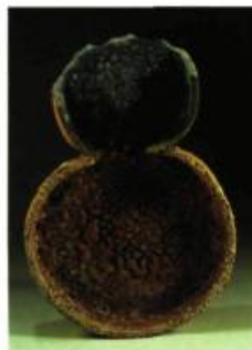
John Chalke (Alberta) Nibbled Eight 38 x 26 cm