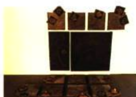
Patricia Gauvin (Québec) Terre en transit 174 x 285 cm