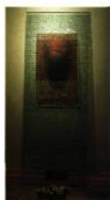
Marie-Christiane Mathieu Objet: Mort d'objet 65 x 24 cm

Chez Sally Smith, le thème Terre en transit s'est traduit par l'appropriation et la transformation d'un patrimoine — la machine agricole de ses ancêtres. Avec les pièces elle a produit une sculpture. Ainsi le passé, désormais partie intrinsèque de l'œuvre contemporaine, rétablit définitivement un lien essentiel entre l'artiste et ses origines.