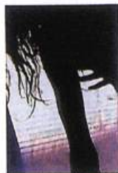
Éditions Éric Devlin (Canada)