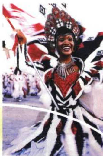
Danseuse de samba

effectuées au Brésil, œuvres de Lyne Charlebois. Organisée, du 1 er novembre au 2 décembre 2001 avec le Cirque du Soleil, cette exposition rend compte des activités du Cirque au Brésil via son programme Cirque du monde .**