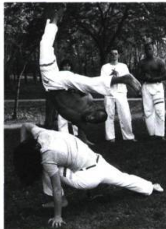
École de Capoeira Pau, Brésil