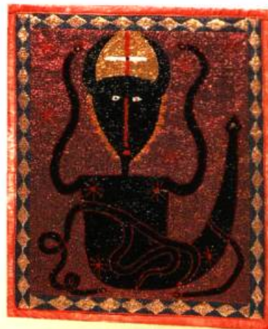
Charmeur de Serpent à Deux Cornes techniques mixtes, 99 x 84 cm Maxon Scylla, 1990

Outre son aspect esthétique impressionnant, cette manifestation cherche à démystifier le vaudou, à le débarrasser des connotations folklorisantes afin de mieux saisir la portée et l'importance de cet héritage et sa résonance actuelle tant du point de vue social que du point de vue artistique. Ainsi, l'exposition rend compte d'une forme traditionnelle d'art populaire religieux, une forme qui sert parfois à déclencher l'imaginaire. Dans certains cas, cette forme artistique devient un véhicule de messages politiques.