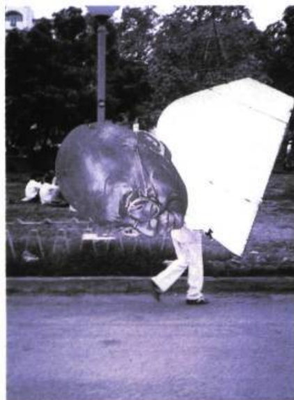
Postcards for Gandhi Ram Rahma, 1995