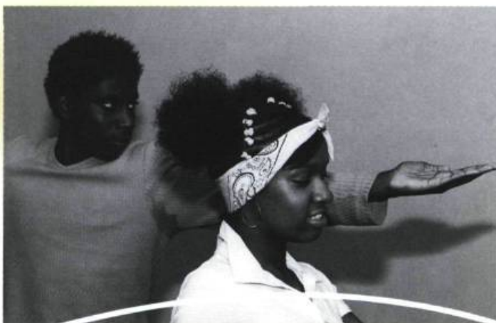
Jeunes performeurs du BTW