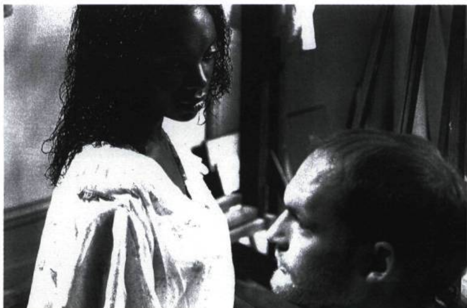
Scène tirée du film Angélique court métrage du réalisateur Michael Jarvis

En outre, au cours d'un symposium organisé par le BTW (Black Theatre Workshop) et les Grands Ballets Canadiens de Montréal, danseurs et chorégraphes afro-américains viendront échanger sur l'influence que l'esclavage a pu avoir sur les arts d'interprétation. Une rencontre captivante qui permettra de donner un éclairage différent au travail des créateurs contemporains.