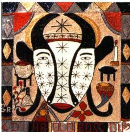
Diabolo Bassou, techniques mixtes, 97 x 100 cm Petit Frère Mogirus, 1998

Placés au cœur du rituel vaudou, les drapeaux servent, notamment, à exercer leur influence magique en favorisant la rencontre entre le monde physique des cinq sens et le Joa (l'esprit). Ces drapeaux, ornés de paillettes et de perles de verre, révèlent une multitude de symboles reliés au Joa . Ce dernier peut épouser une forme humaine ou animale. Les esprits les plus importants exercent leurs influences sur la santé, les cultures agricoles, la vie amoureuse, la sécurité et le destin. Ainsi, dans l'un des pays les plus pauvres de la planète, la foi peut vaincre l'adversité.