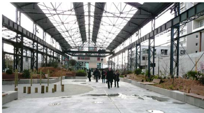
Figure 5. A l'Est de l'île, l'éco-jardin des Fonderies livré en mai 2009 sous une halle industrielle construite en 1937 (en activité jusqu'en 2001). 60 % de la surface a été recouverte d'une toiture transparente en polycarbonate cristal et les anciens fours ont été réhabilités. Le jardin est autonome en énergie : récupération des eaux de pluie pour l'arrosage et système de pompe alimenté par production solaire (maîtrise d'œuvre : atelier Doazan-Hirschberger – Bordeaux et financement REVIT).