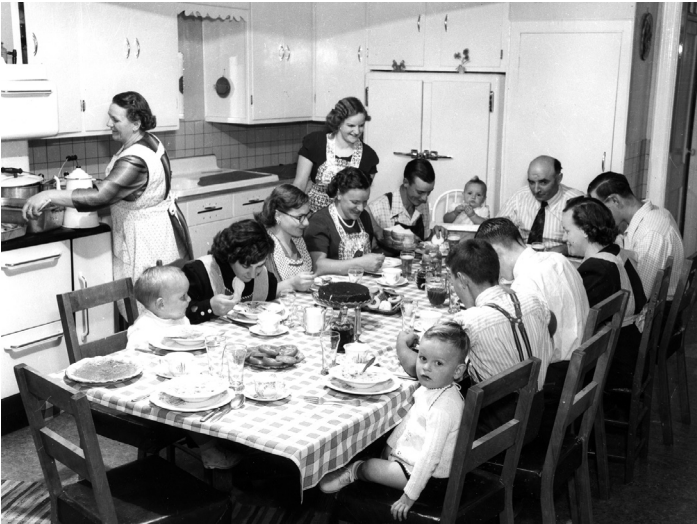
La cuisine typique d'un intérieur québécois des années 1950.

Nous avons distingué dix grandes fonctions de consommation, qui correspondent à autant de besoins, à autant de dimensions des genres de vie des ménages. Leur identification parle d'elle-même mais il importe de donner des précisions. L'alimentation comprend les dépenses pour les aliments achetés et transformés au foyer mais aussi les repas pris à l'extérieur à cause du travail. Les repas pris au restaurant lors de sorties ou lors de voyages sont classés dans la fonction loisirs. Le logement comprend toutes les dépenses courantes faites par les propriétaires et les locataires, mais elles excluent les remboursements du capital de l'hypothèque avant 2001, considérés comme une épargne. Nous n'avons pas estimé de loyer fictif pour les propriétaires ayant totalement remboursé leur hypothèque.