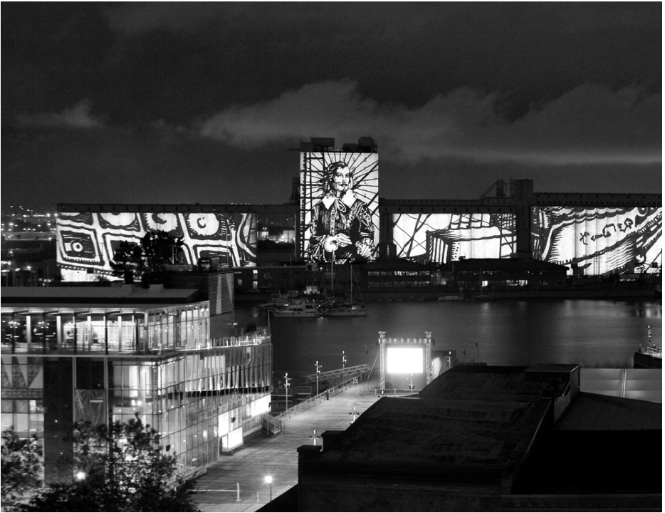
Une scène du Moulin à images produit par l'équipe Ex Machina de Robert Lepage dans le Vieux-Port de Québec, à l'été de 2008.