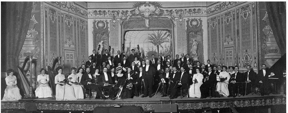
La Société symphonique de Québec, fondée par Joseph Vézina en 1902.

Ainsi, la tradition musicale héritée du siècle précédent se consolide. Deux sociétés chorales, l'Union musicale de Québec (1866 - 192 ?) et la Société musicale Sainte-Cécile (1869-1890) présentent des grandes œuvres du répertoire classique incluant des messes, des oratorios et des opérettes. Les fanfares militaires et paroissiales fleurissent également. Mais c'est l'essor de la musique symphonique qui marque un véritable tournant avec la fondation de la Société symphonique de Québec par Joseph Vézina, en 1902. La Société devient par la suite l'Orchestre symphonique de Québec, après avoir vu naître entretemps un groupe dissident, le Cercle philharmonique de Québec (1935-1942). Toute cette activité musicale alimentée par la vie militaire, l'art sacré et les récitals de pianistes et autres solistes invités par le Club musical des dames de Québec fondé en 1891, expliquent que Québec ait pu devenir au fil des ans une pépinière de musiciens et de chanteurs d'opéra dans la foulée des Calixa Lavallée et des Raoul Jobin. Et cela en dépit de l'absence d'un Conservatoire de musique qui ne voit le jour qu'en 1944.