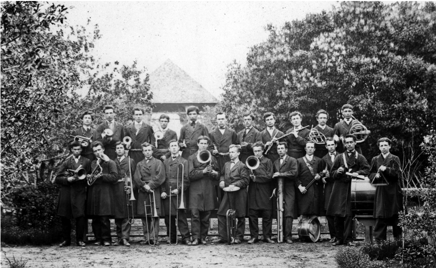
Le corps de musique du Petit Séminaire de Québec en 1866-1867.