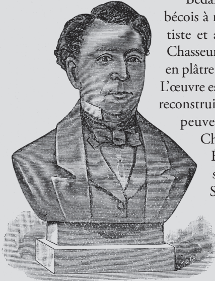
Dessin du buste de Pierre Bédard, œuvre de Pierre Chasseur en 1833. Ce dessin est le seul portrait connu de Pierre Bédard. (BANQ)

Bédard a été le premier parlementaire québécois à recevoir l'honneur d'une statue. L'artiste et amateur d'histoire naturelle, Pierre Chasseur, de Québec, réalise en 1833 un buste en plâtre représentant Pierre-Stanislas Bédard. L'œuvre est exposée dans l'édifice du parlement reconstruit entre 1831 et 1833 1 . Les visiteurs peuvent la voir à la Bibliothèque de la Chambre d'assemblée, alors dirigée par Étienne Parent lui-même 2 . L'année suivante, par l'entremise du député de Saguenay, François-Xavier Tessier, et de l'orateur, Louis-Joseph Papineau 3 , la Chambre d'assemblée en fait officiellement l'acquisition.