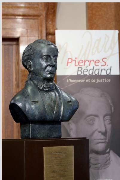
Buste en bronze de Pierre Bédard, réalisé par l'artiste Pascale Archambault et exposé à l'Assemblée nationale du Québec depuis 2010.

de réunir des souscriptions pour réaliser un nouveau buste de Bédard inspiré de l'original disparu. Les historiens, les députés, les juges, les avocats, les journalistes, diverses associations québécoises ont répondu à l'appel. L'artiste Pascale Archambault a redonné dans le bronze un visage à Pierre Bédard. Cette œuvre a été dévoilée le 28 mai 2010 par le président de l'Assemblée nationale, monsieur Yvon Vallières.