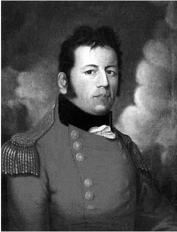
Sir George Prevost, gouverneur du Bas-Canada de 1811 à 1815.

À Québec, l'année 1811 est celle d'une nouvelle donne sur le plan politique. Quelques semaines après sa libération, Bédard apprend que sir James Craig quitte le Bas-Canada et retourne en Angleterre « vu le faible état de [sa] santé » qui le rend incapable de remplir ses devoirs de gouverneur 20 . Il laisse l'intérim de son gouvernement à Thomas Dunn, le doyen du Conseil exécutif et s'embarque le 19 juin sur la frégate Amelia après avoir reçu les hommages de circonstance de divers groupes de citoyens et surtout de ses partisans 21 . La Gazette de Québec , publiée à son tour le compliment d'usage qu'elle doit rendre au « vice-amiral de l'Amérique septentrionale britannique », mais ajoute ce commentaire ambigu : « Tout ce qu'on pourra dire maintenant de ce personnage sera dit comme si c'était après sa mort. Nous ne le verrons plus, et aucun de nous ne pourra plus l'approcher davantage. Il a pris sa place dans l'histoire où sa réputation croîtra en proportion qu'il sera jugé avec rigueur 22 . » Sir James effectue une calme traversée, mais sa retraite est de courte durée, car il s'éteint à Londres le 12 janvier 1812.