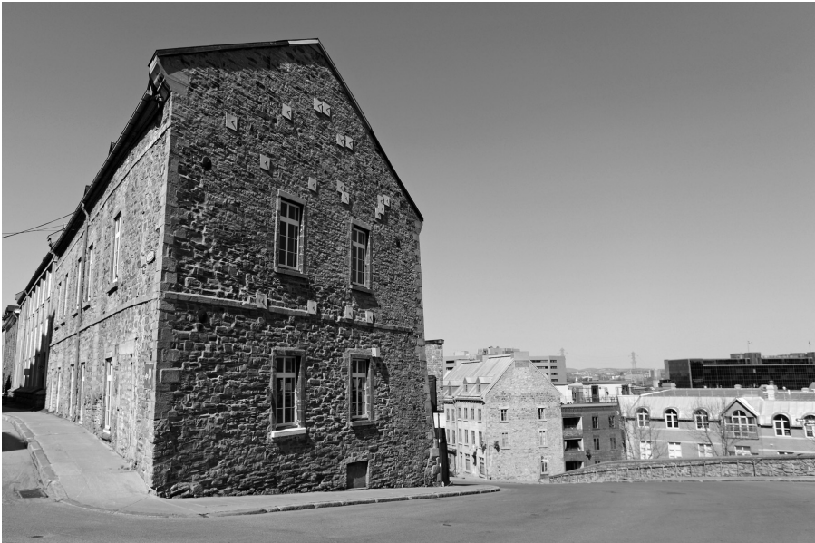
La prison commune de Québec en 1810 située dans l'ensemble des Nouvelles casernes. C'est dans cet édifice que Bédard fut emprisonné et non dans la nouvelle prison de la rue Saint-Stanislas, devenue plus tard le Morrin Center.

Les mansardes étant crépies, donnèrent le temps de sauver une grande partie des effets de ce dernier monsieur.