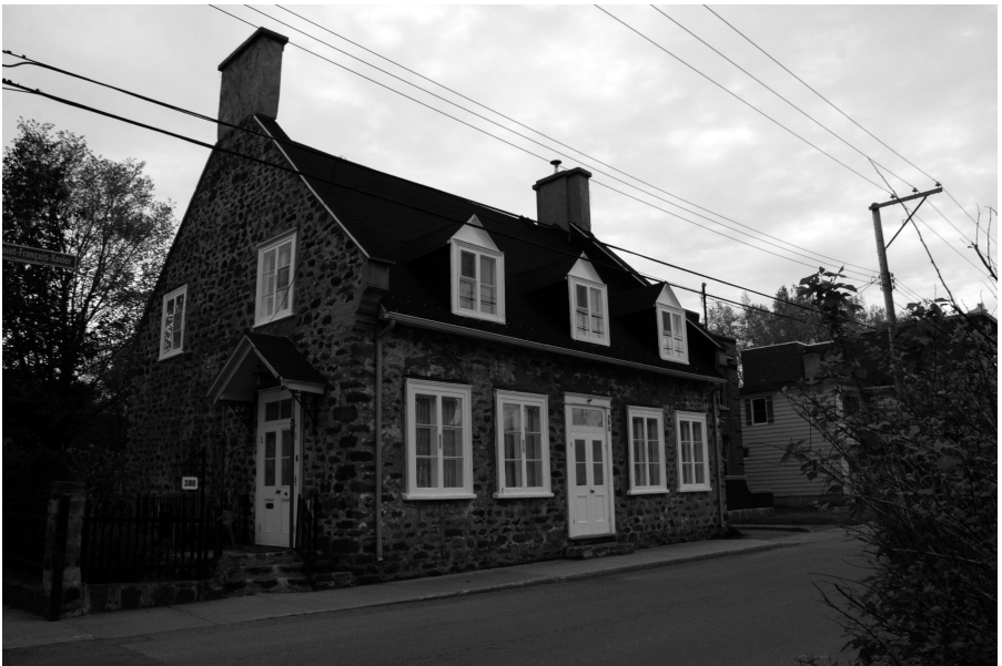
Les deux maisons de Trois-Rivières où aurait vécu Pierre Bédard. La première à l'angle des rues Ferland et des Commissaires, jusqu'en 1825 ; la seconde rue Saint-François-Xavier où il serait mort en 1829.