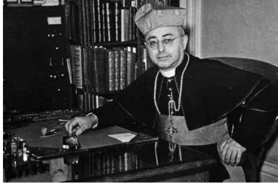
Le Cardinal Jean-Marie Rodrigue Villeneuve o.m.i. (1883-1947), archevêque de Québec (1931-1947), membre du Comité catholique du Conseil de l'Instruction publique.

Archives des Dominicaines Missionnaires Adoratrices, Québec.