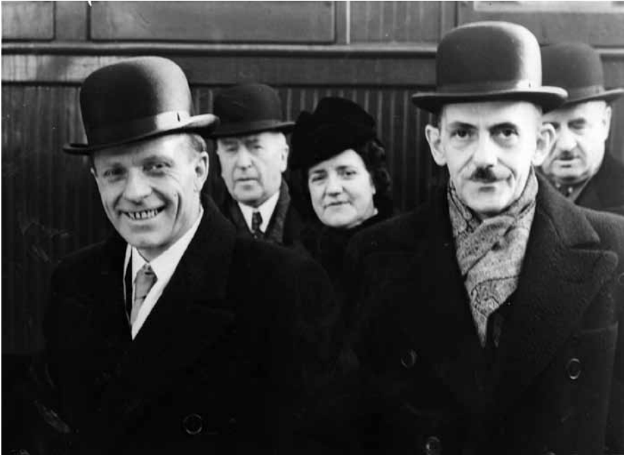
Hector Perrier en compagnie du premier ministre Adélard Godbout, vers 1940.

Le nouveau ministre Perrier pouvait afficher une feuille de route impressionnante et crédible comme personnalité publique. Détenteur d'une licence en droit (1920) ainsi que d'une licence en sciences politiques, économiques et sociales (1922) de l'Université de Montréal, il est admis au Barreau en 1922. Il pratique le droit de 1920 à 1947 en s'associant, notamment, au cabinet d'Athanase David. Son intérêt pour la politique remonte à 1920, alors qu'il est élu président de la Jeunesse libérale de la Province. L'enseignement universitaire s'ajoute à son expertise, puisqu'il enseigne le droit industriel à la Faculté des sciences sociales, économique et politiques de l'Université de Montréal, de 1930 à 1947. Il y côtoie régulièrement Édouard Montpetit, doyen de la Faculté. On le retrouve également très tôt dans l'organisation scolaire. Il est nommé membre de la Commission des écoles catholiques de Montréal, de 1928 à 1937 et président de son Comité de législation. C'est là qu'il fait la connaissance de Victor Doré, le nouveau président de la CÉCM, avec qui il se lie d'amitié. Les deux hommes partagent, du reste, les mêmes vues sur les réformes à apporter au système d'éducation au Québec. En 1933, Perrier est nommé au Comité catholique du Conseil de l'Instruction publique.