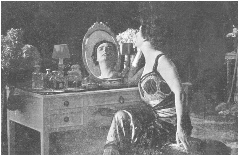
Figure 5. Le jeu du reflet : entre portrait et miroir ( Frou-Frou , 1918)

Le visage de la diva n'est pas qu'un visage ordinaire, c'est un visage-tableau : maquillé, composé, éclairé. Yeux et bouche sont accentués, certes, mais une attention particulière est accordée au travail de la lumière, à la photographie, aux effets de flou ou de lumière frissante qui donnent aux traits, comme à la pose, une valeur à la fois abstraite et dramatique, produisant l'effet d'un visage peint. Parfois, ces effets sont accentués par différents « jeux de miroirs », dans lesquels les images du féminin se trouvent enfermées. Par exemple, dans le film Frou-Frou (Alfred De Antoni, 1918), l'actrice change trente fois de tenue en une heure, effectuant, comme un mannequin, une véritable