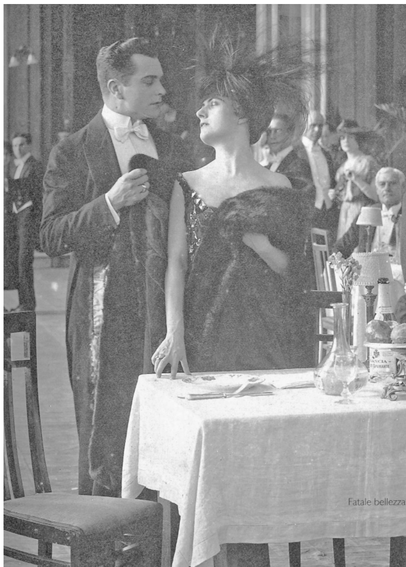
Figure 3. La gorge et le regard : fatale beauté ( Bellezza Fatale , 1919)

est trop éloigné pour avoir autre chose qu'une vision d'ensemble, l'écran permet la proximité, l'intimité avec le corps même de l'actrice, en tant qu'icône du féminin, et ce tout particulièrement dans les plans qui insistent sur la gorge et le visage. Il ne s'agit plus ici seulement de la beauté ni de la