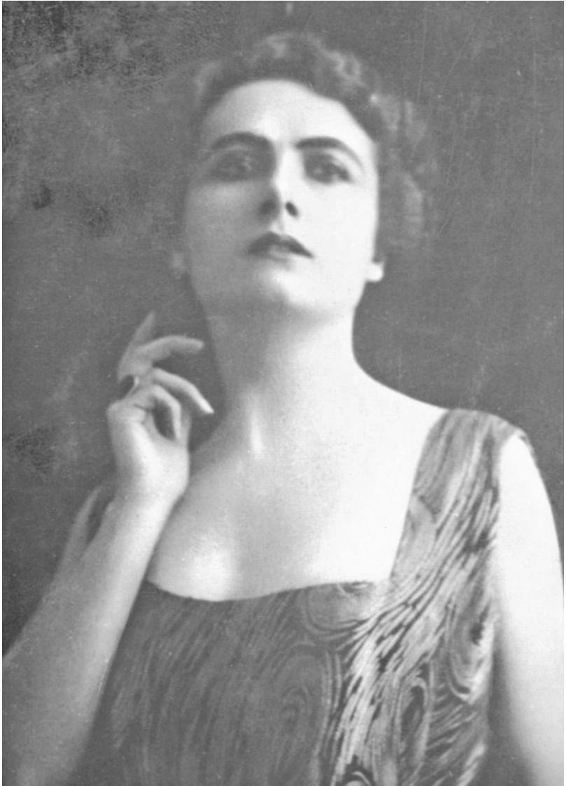
Figure 4. La magie du visage ; portrait de Francesca Bertini

gestuelle ou des mimiques expressives, mais de la manière dont l'art du cinéma les magnifie. Trois armes sont essentielles pour cela : le jeu des regards, le gros plan et l'éclairage.