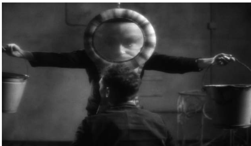
Institut Benjamin (S. Quay et T. Quay, 1995). Illustrations : Zeitgeist Films. © Koninck Studio Ltd.

énonce les chiffres écrits au tableau qui enjoignent les élèves à réciter leur leçon, et ses mots, comme ceux avec lesquels il a accueilli Jakob, ont une sonorité telle qu'ils semblent émis par une autre voix.