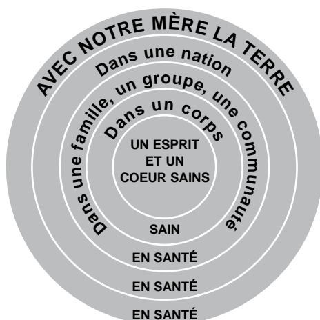
LES CERCLE DE SANTÉ DES PREMIÈRES NATIONS (CSSSPNQL 2005)

Les Autochtones considèrent la santé comme « un état de bien-être à la fois psychologique et social qu'engendre et entretient, chez l'individu comme dans le groupe sociétal dont il fait partie, une démarche globale fondée sur l'harmonie, le respect mutuel et la fidélité à des valeurs essentielles partagées » (Petawabano, 1994). L'individu, fort des quatre dimensions de son existence (physique, mentale, émotionnelle et spirituelle), vit en interrelation avec sa famille, sa communauté et sa nation, comme le montre le cercle de santé des Autochtones.