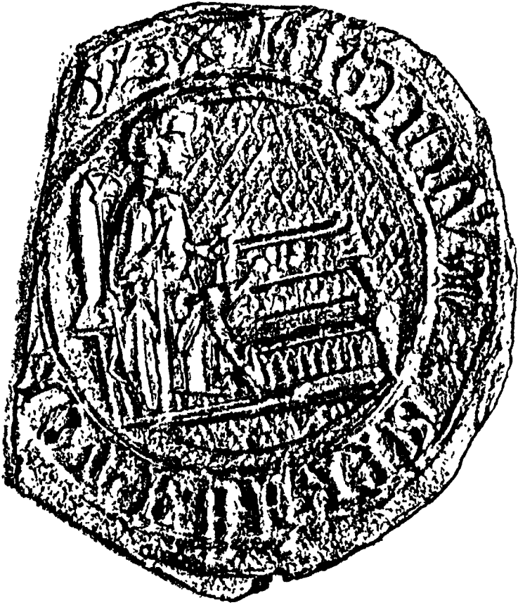
Sceau de la corporation des monnayeurs et batteurs de la Monnaie royale, xv e siècle