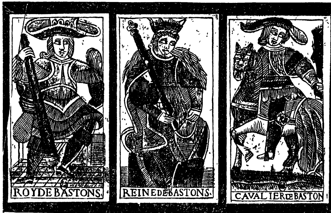
Cartes anciennes du jeu divinatoire de Tarot.