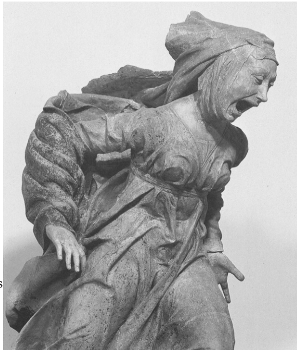
Marie-Madeleine, détail de Lamentation sur le corps du Christ, dernier quart du xv e siècle, Santa Maria della Vita, Bologne.

Cet enchaînement 14-72-82 / 24-32-47 / 68-56-40 constitue une typologie propre parmi d'autres possibilités 4 . L'ensemble de l'office est récité in persona defuncti (Martimort, 1961, p. 624-625) et les textes expriment les sentiments d'un mort qui, en fait, ne l'est pas : il crie et se lamente ; il affirme son espérance (R. 14 et 24). Dans le même temps, certains répons changent de locuteur et s'affirment davantage comme une prière pour le mort (R. 72). L'office oscille donc toujours entre l'expression singulière du mort et celle collective de la communauté intercédant pour lui : cette oscillation donnera lieu, comme nous le verrons, à des aménagements textuels conscients dans Albi 15. Le premier nocturne souligne, avec insistance ici, la demande de paix : au verset Requiem eternam (198) succède le répons (198) sur le même texte. Le deuxième nocturne présente un enchaînement dont le ms. Albi 15 est le plus ancien témoin connu 5 . La troisième section est, elle aussi, assez originale dans son enchaînement : on la retrouve dans des sources plus tardives, à Toulouse